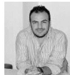
USCENTE Paolo Foresio, il più giovane rappresentante del Partito democratico