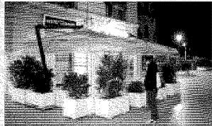
COSTARELLA IN CRONACA >>>

Gazebo da abbattere a Bari ormai è rivolta I gestori dei pub assiedono Comune e prefettura