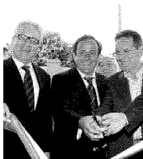
UEFA Platini rieletto, Matarrese membro d'onore