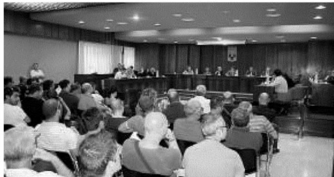
ESASPERATI Serrato confronto nell'aula consiliare alla presenza di esponenti politici, sindacali e della proprietà dell'Omfesa