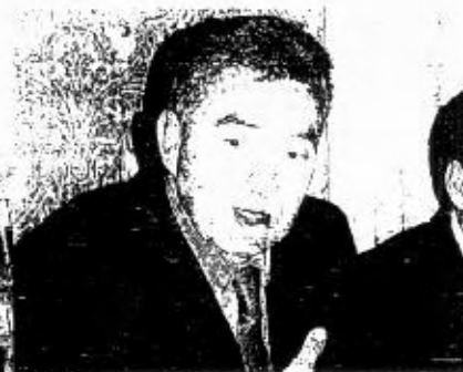
SI PUNTA ALLA PREVENZIONE. Il sottosegretario all'Interno Alfredo Mantovano domani in Prefettura

bambini e persone anziane in difficoltà, inetti e persone sospette, nonché la presenza di ostacoli sulle vie di comunicazione. In genere, tutte quelle situazioni che facciano presumere la commissione di reati o che evidenzino situazioni di degrado urbano e disagio sociale.